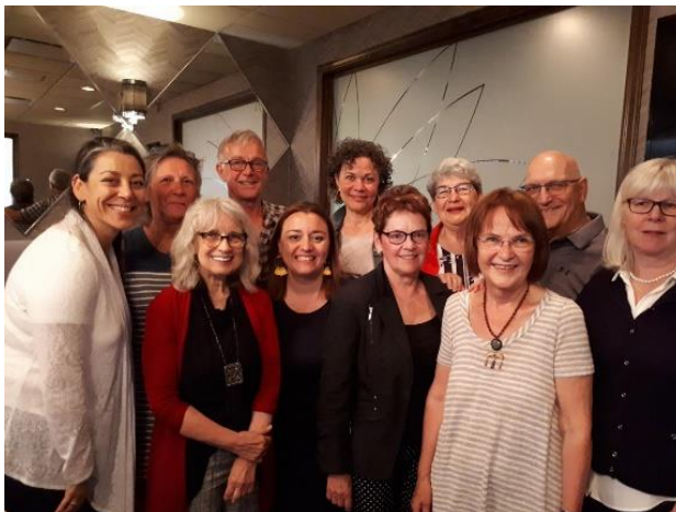
Photo lors de la remise des attestations

La formation 36 heures du printemps s'est terminée en juin 2019. Les 14 participants de ce groupe ont été animés d'une volonté à partager entre eux et avec les formateurs leurs questionnements, commentaires et expériences. De ce groupe, sept personnes sont maintenant bénévoles et une personne est devenue formatrice.